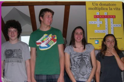
Organspendertag - AIDO in der Schule