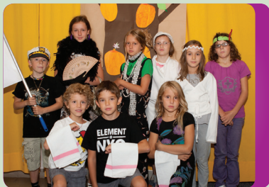
Ferienwoche in den Bergen

39100 Bozen Latemarstraße 8 Tel. 0471 974431 www.ehk.it info@ehk.it