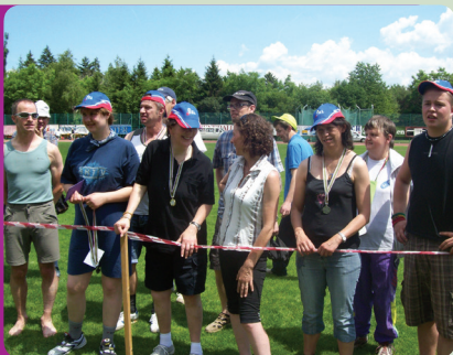
Mitmachen beim Sporttag