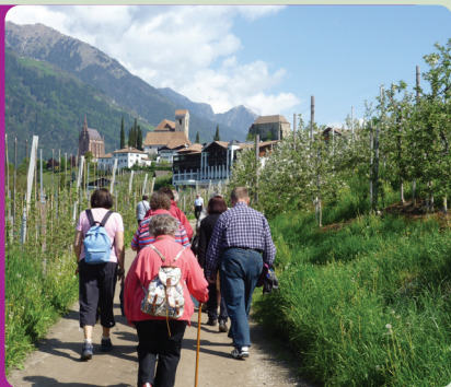
Wanderung in den Bergen