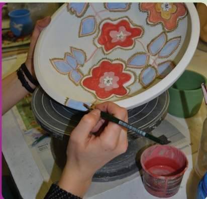
Kunsthandwerkliches Arbeiten beim CIRS