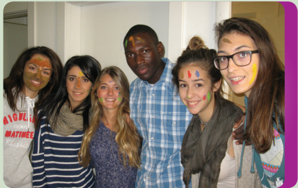
Ein gemeinsames Fest