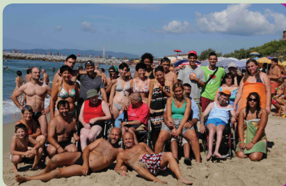
Ferienaufenthalt am Meer

39100 Bozen G. Galileistraße 4/a Tel. 335 5452470 www.aadh.it info@aadh.it