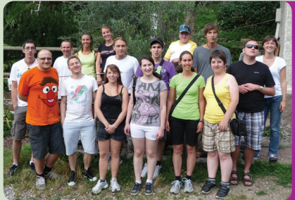
Gerüchen und Geräuschen auf der Spur