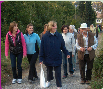
Gesund wandern in Lana